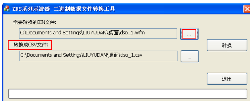
图 1.1 软件界面

选中二进制文件后，转换成的 CSV 文件保存的路径会自动生成，您可以根据需要进行修改。点击转换，下面会出现转换的进度条，最后会弹出文件转换成功的提示。这时，点击退出，根据自动生成的 CSV 路径可以查看转换的 CSV 文件。